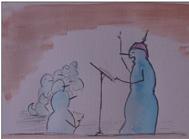
Figuur 4: W12 zelf, op een wazige schets. 'Toon uw grootsheid aan de wereld', lijkt hij te zeggen.

Dames en heren, geachte grootschalige fenomenen, het mag duidelijk zijn dat wij slechts in ons opzet kunnen slagen indien we allen onze taak kennen, indien we allen begripvol met elkaar omgaan, en indien we allen naadloos met elkaar communiceren. U weet, ik ben geen fan van Atlantische depressies of van