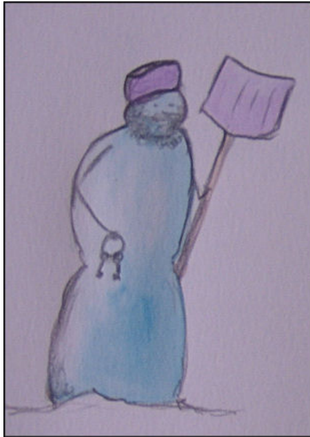
Figuur 3: De Groenlandblokkade. Struise en sympathieke kerel. Ziet er ouder uit dan hij werkelijk is.

Ik richt me nu heel even, en zonder iemand iets kwalijk te willen nemen, tot u, geachte Groenlandblokkade, hier rechts vooraan in de zaal. U is het toch met mij eens, mijn waarde, als ik u vertel dat voor het bekomen van flink winterweer in lage landen u zich best niet al te westelijk positioneert? Want dat u, in geval u dit toch doet, verantwoordelijk is voor de inval van ijzige lucht boven de wateren ten westen van Noorwegen? En dat in voornoemd geval de kansen op winterweer in de lage landen sterk gehypothekeerd worden? Ja, hé? (glimlacht en opnieuw gegniffel in de zaal). Ach kijk, u hoeft er zich verder geen zorgen over te maken. Iedereen maakt foutjes. Zo heb ik eens een Genua-laag gekend dat dacht een uitstapje te kunnen maken tot voorbij Bordeaux. Helemaal fout dus. Ze viel volledig uit haar rol.