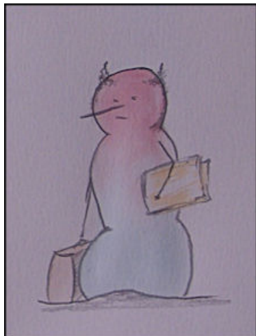
Figuur 2: Het Azorenhooft. Beetje een zenuwpees, naar verluud. Bemerkt ook zijn merkwaardige kapsel.

Wat betreft het gebruik van de gsm. Het spreekt voor zich dat u allen zal kunnen blijven beschikken over het toestel dat u vorig jaar werd toegekend 6 . Dit past geheel in onze communicatieplannen, waarvan ik daarnet reeds de kern heb toegelicht en die verder zullen besproken worden op dag drie van deze conferentie. Misschien alvast vermelden dat de kosten voor de gesprekken, in geval van bewezen