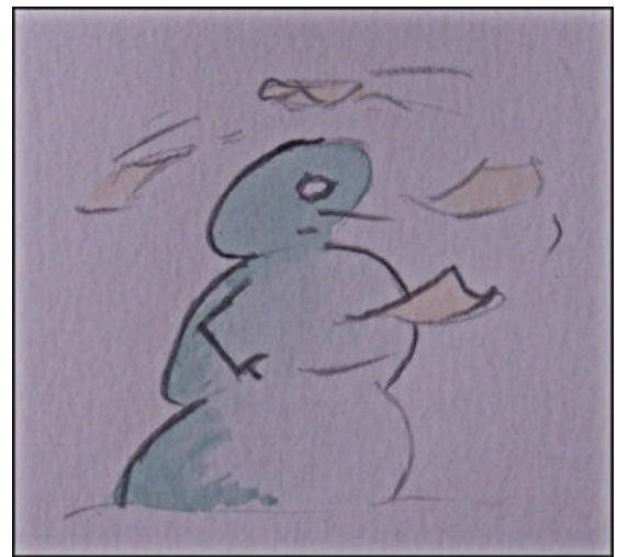
Figuur 1: orkaan Margareth (categorie 4). Ze is vaak niet welkom op conferenties omdat ze notities in de war pleegt te brengen. Ze heeft tevens slechts één oog.

Laat ik deze doelstellingen nog eens bondig herhalen. We dienen onze activiteiten toe te spitsen op een gebied dat men de lage landen noemt, en wel zo dat aldaar in het komende seizoen sprake moet zijn van een barre winter 2 . Ik heb de vrijheid genomen om deze laatste term nader te specificeren, want u begrijpt dat wat voor de ene 'bar' is, door anderen met hetzelfde gemak als normaal wordt bestempeld. En we kunnen ons dergelijke onduidelijkheden niet veroorloven. Grof gesteld moeten we komen tot twee basisrealisaties. Eén, stevige vrieskou (en bijhorende ijsvloer), en twee, herhaalde sneeuwstormen actief over het volledige grondgebied (ook de Vlaamse kuststreek) afgewisseld met felle buien van